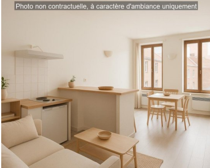
Photo non contractuelle, à caractère d'ambiance uniquement