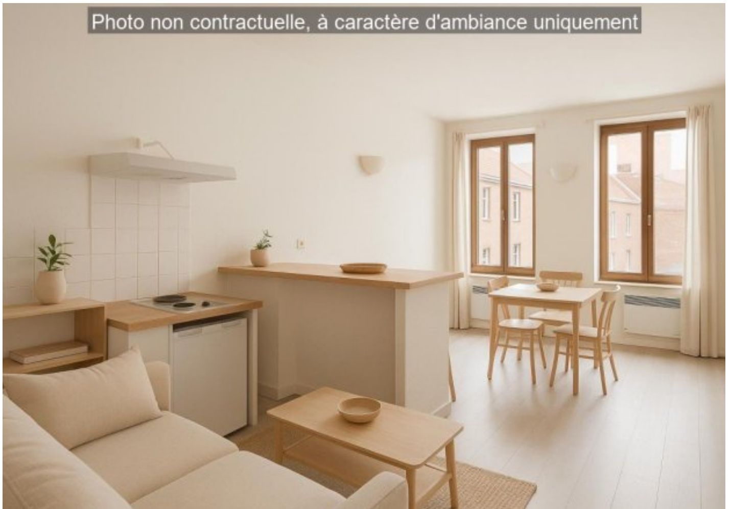
Photo non contractuelle, à caractère d'ambiance uniquement